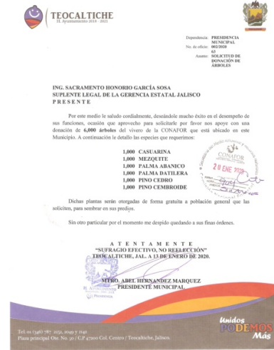
Gráfico o evidencia.

Gestión de programas en las diversas Secretarías y Dependencias, estatales y federales.