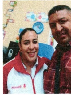
3 v 15